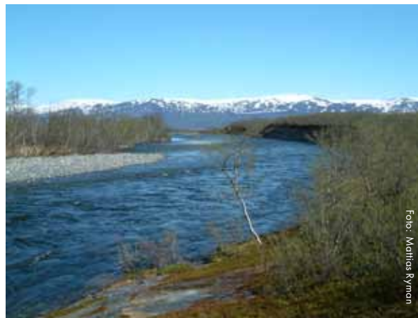
Abiskojokk vid Torneträsk i Norrbottens län

Om en sjö har flera utlopp som går vidare till olika vattendrag, kallas även detta en bifurkation. En förgrening kan också förekomma vid ett vattendrags mynning. Ett exempel är Göta älv som vid Kungälv delar upp sig i två grenar; Nordre älv och Göta älv.