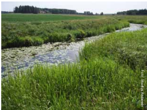
Sagaån i Norrströms avrinningsområde, Västmanlands län

En å är oftast större än en bäck och mindre än en älv, men det finns inga tydliga storleksgränser mellan dem och ett vattendrag som benämns bäck i norra Sverige kan vara större än en å i södra delen av landet.